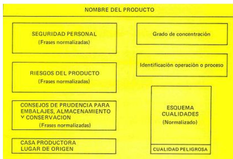
Ejemplo de posible ubicación de datos en la etiqueta

La señalización obligatoriamente identificará