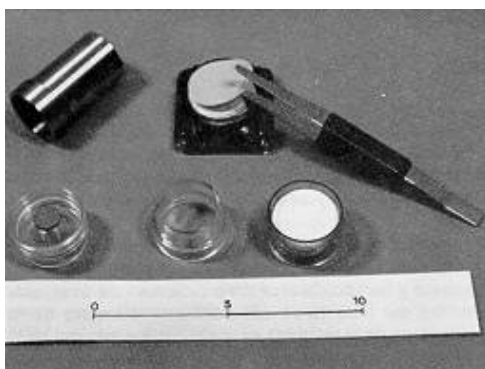
Fig. 2: Componentes de la unidad de captación