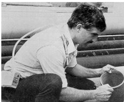
Fig. 3: Toma de muestras de amianto

Se pone la bomba en funcionamiento y se inicia la captación de la muestra. Durante la misma debe vigilarse periódicamente que la bomba funcione correctamente. Caso de que se aprecien anomalías o variaciones sobre el caudal inicial se vuelve a recalibrar la bomba, o se procede a anular la muestra.