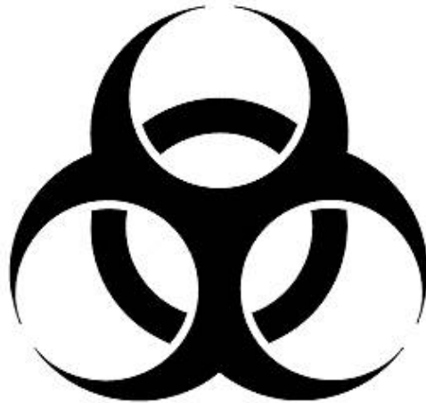
Fig. 1: Señal de peligro biológico. (Directiva 679/90)