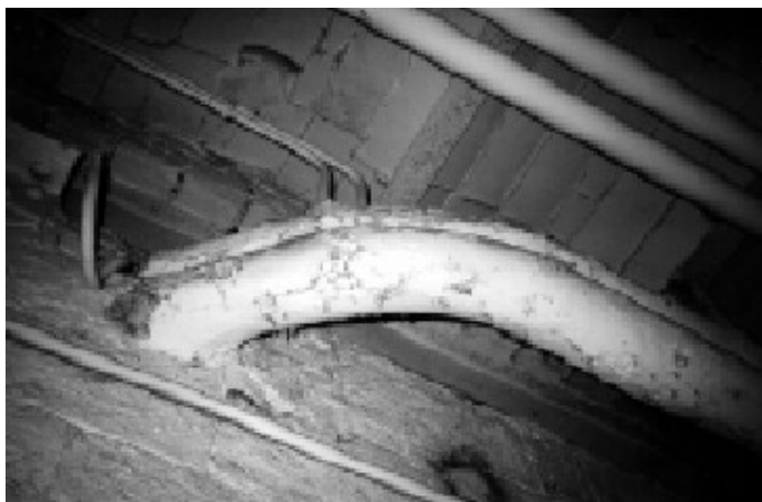
Figura 3. Calorifugado de una tubería con material con crisotilo, que requiere reparación.

En la figura 3 se observa un posible trabajo de reparación, que por lo reducido del espacio, presentaría unas características específicas que deben constar en el plan de trabajo.