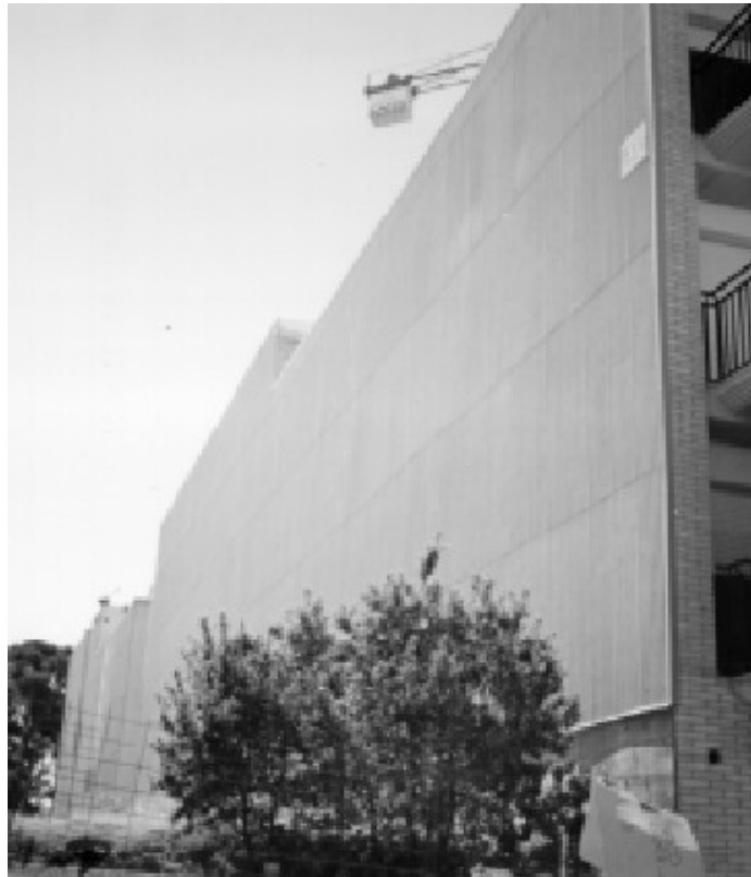
Figura 1. Material de fibrocemento en un edificio en construcción

A pesar de lo expuesto hasta aquí, en la figura 1 se observa que el amianto es utilizado en nueva construcción. La fotografía fue realizada en junio de 1999.