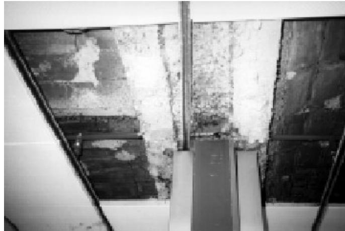
Figura 4. Ignifugación de la estructura metálica en un edificio de oficinas, con material de crisotilo y amosita

En la figura 4 se presenta un ejemplo de una estructura metálica ignifugada, de la que se va a proceder al desamiantado. La empresa que realiza los trabajos de desamiantación es la que tiene que presentar el plan de trabajo correspondiente.