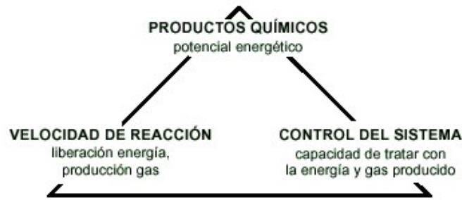
Figura 2. Factores que determinan el diseño de un proceso químico seguro

Hay tres ámbitos principales de análisis que determinan el diseño de un proceso químico seguro (figura 2).