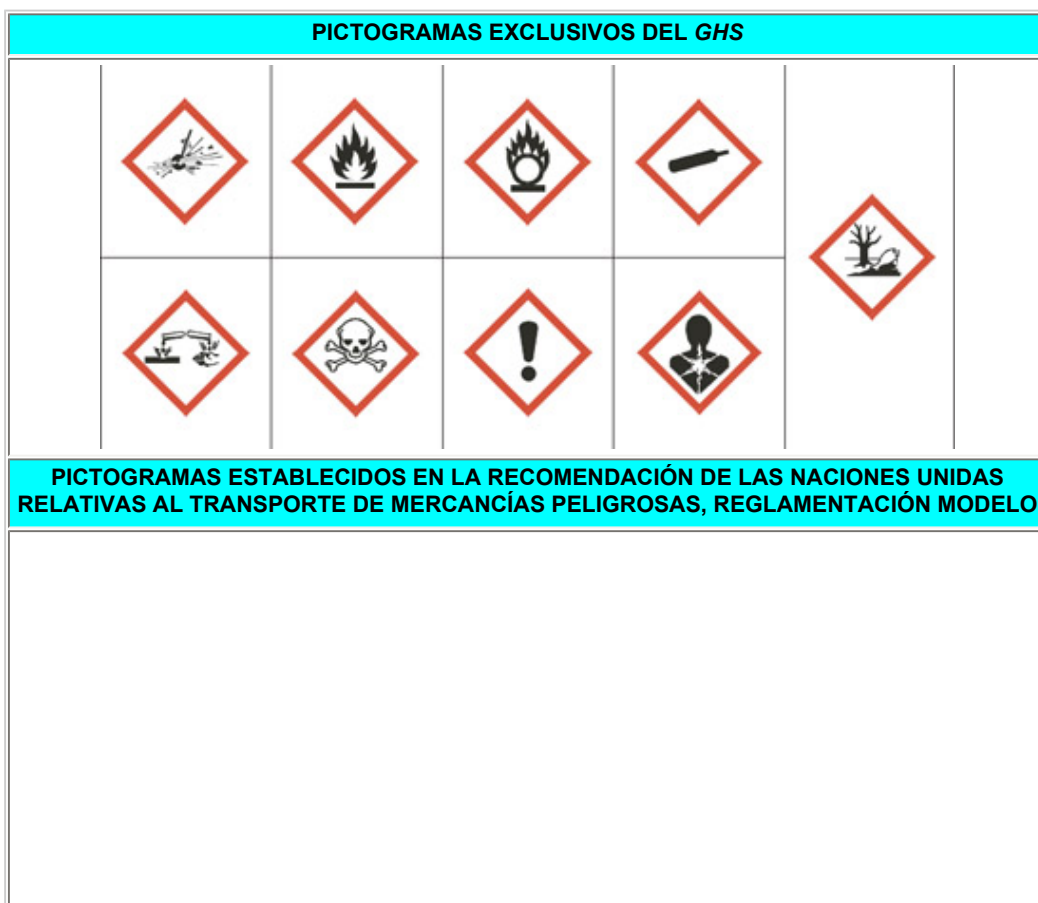
Figura 4 Pictogramas utilizados por el GHS

Parte de los símbolos de peligro que se presentan en la figura 4 fueron tomados de las Recomendaciones de las Naciones Unidas relativas al transporte de mercancías peligrosas.