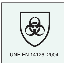
Figura 1. Pictograma y referencia de la norma