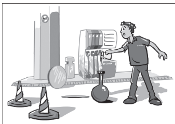
Figura 3. Metrología