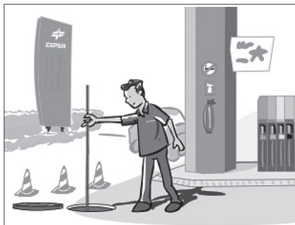
Figura 2. Varillado