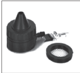
Figura 3. Muestreador cónico CIS

Finalmente, el PAS-6 es otro muestreador de tipo cónico desarrollado en Holanda (Institute of Risk Assessment Sciences), que tiene una geometría parecida al muestreador PGP-GSP 3,5 y al CIS. Es de naturaleza metálica y capta las partículas inhalables de los aerosoles a un caudal de 2 \pm 0,1 l/m sobre un filtro de 25 mm, a través de un orificio de entrada de 6 mm de diámetro.