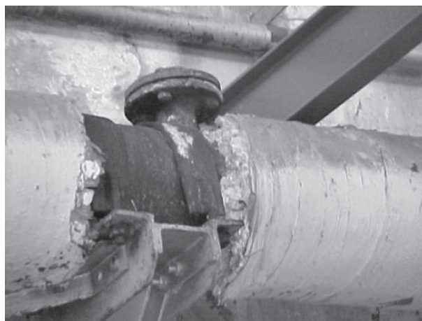
Figura 3. Calorifugado con amianto

En la figura 3 se observa un posible trabajo de reparación o retirada de material friable (que se deshace con facilidad) que presenta unas características específicas que deberán constar en el plan de trabajo, como medidas de confinamiento (glove-bag, burbuja con depresión), equipos individuales de protección respiratoria, entre otras.