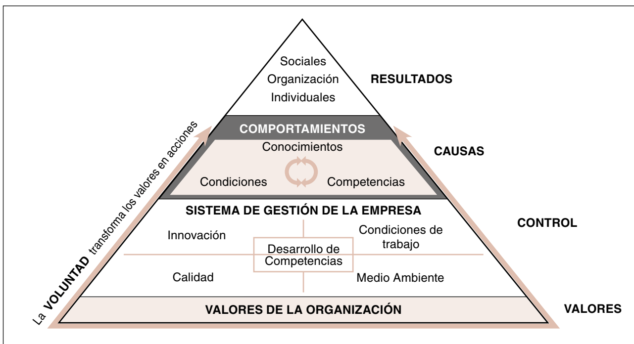
Figura 1. Modelo integral de gestión empresarial

basado en el diálogo, que facilita la toma de conciencia de la necesidad de su evaluación y de su control, con la implicación y el compromiso de la dirección y de los trabajadores o de sus representantes, no solo ayudará a conciliar posturas, si no que se estarán también creando las condiciones que harán posible la construcción de nuevas realidades y de un sistema general de gestión empresarial en el que todos se sentirán copartícipes, algo esencial para poder conducir con éxito todo proceso de cambio.