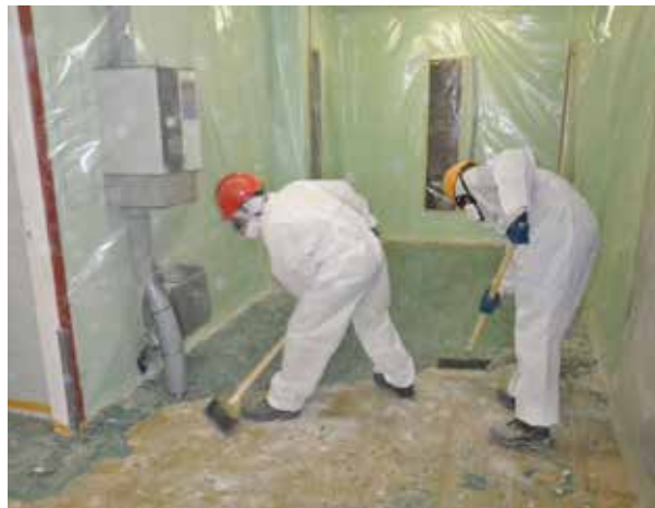
Figura 5. Ejemplo de medidas preventivas en un trabajo de retirada de losetas de amianto vinilo: barreras críticas, trabajo en húmedo, herramientas manuales, ropa de trabajo, equipo de protección respiratoria, retirada continua de residuos.

Los trabajos de retirada de materiales de amianto-vinilo, salvo que se trate de pequeñas intervenciones que cumplan las condiciones de exención indicadas, requerirán siempre plan de trabajo y la intervención empresas especializadas inscritas en el RERA de acuerdo con las disposiciones del Real Decreto 396/2006.