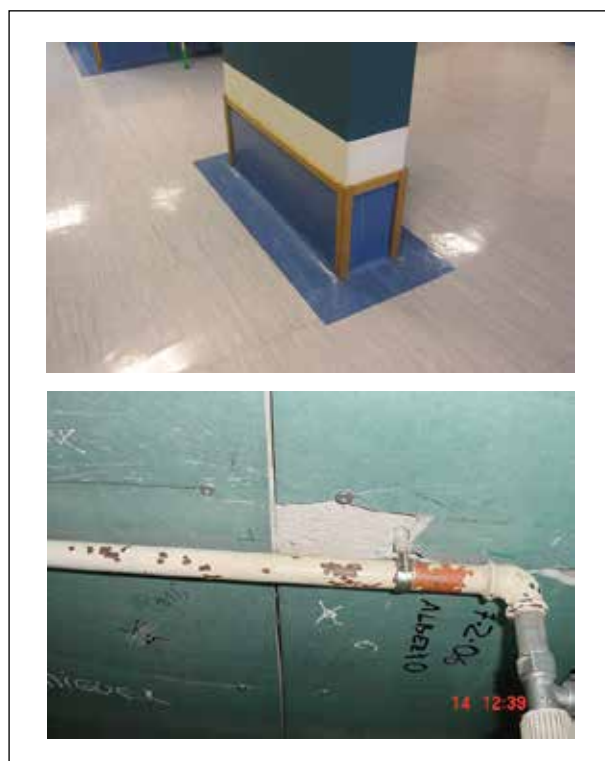
Figura 4. Ejemplos de losetas en buen estado y de losetas dañadas por uso e intervenciones de mantenimiento.