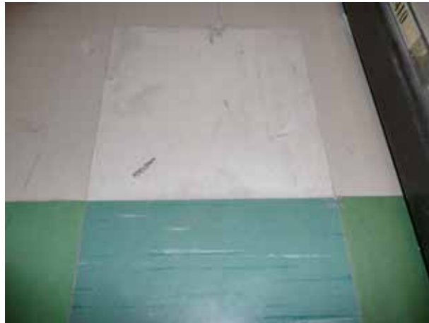
Figura 2. Ejemplo de instalación simultánea de losetas de vinilo con amianto (esquina inferior izquierda) y sin amianto (restantes).

Entre los suelos vinílicos sin amianto más conocidos por tratarse de fabricación nacional (CEPLASTICA, DISTIPLAS. División plásticos ERT) se mencionan SINTASOL 2 , FLEXOL, CESOL, SAIPOLAM.