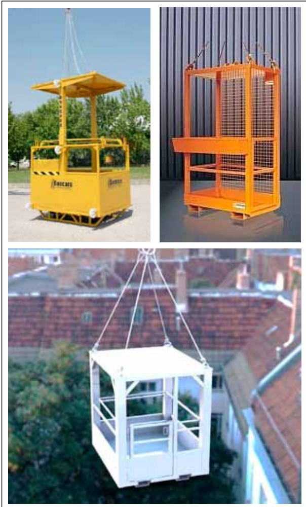
Figura 1. Cesta colgada de varios puntos de anclaje