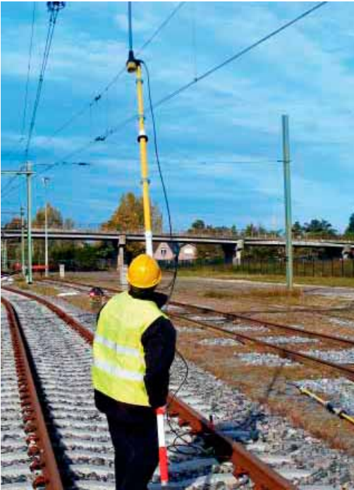
Figura 6: Operaciones de desconexión eléctrica de una instalación ferroviaria.