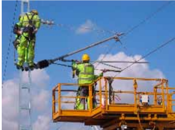
Figura 3. Actividad de ajuste de elementos de compensación mecánica