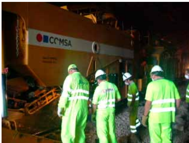
Figura 5. Riesgo de arrollamiento por presencia de maquinaria ferroviaria