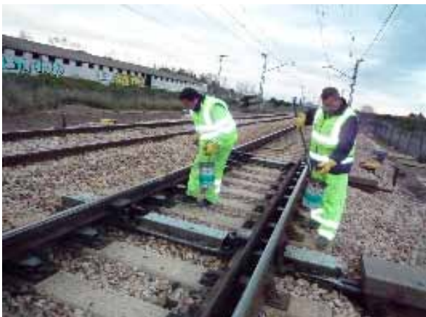
Figura 2. Actividad de engrasado de aparatos de vía