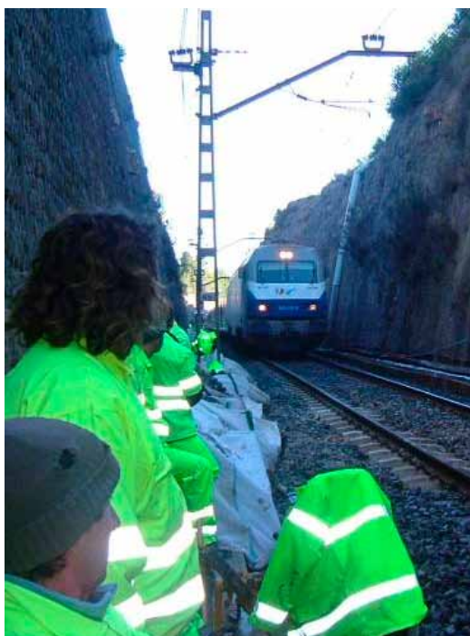
Figura 4. Riesgo de arrollamiento por circulaciones ferroviarias